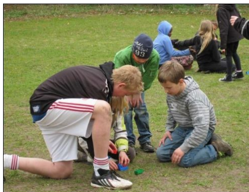
Billeder fra trivselsdagen april 2010